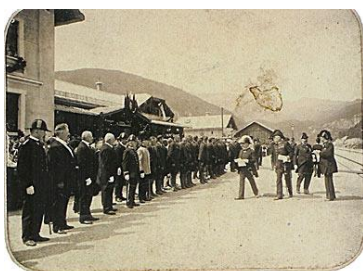
Princelmslednik Franc Ferdinand in drugi gostje na postaji Bohinjska Bistrica ob slovenski četvrtini bohinjske proge 19. julija 1906.

V Bohinju je _____ prebivalcev, naravni prirastek pa je že več let _____. Povprečna starost moških je 38, žensk pa 43 let. Gostota prebivalstva je _____ prebivalcev na km 2 .